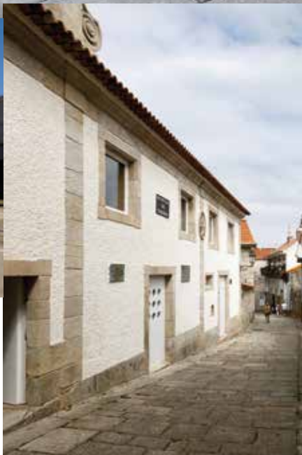
Hospital Sancti Spiritus Construido en el siglo XVII.