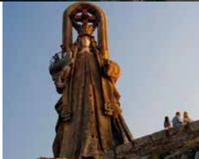
Vierge de la Roca. Statue en pierre de 15 mètres de haut, œuvre de l'architecte Antonio Palacios.