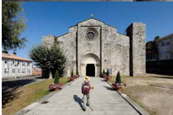
Ancienne collégiale de Santa María, construite au XIIIe siècle.