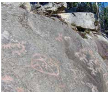
Station rupestre Outeiro dos Lameiros

Marais A foz do Miñor. La rivière Miñor débouche sur ces marais qui font partie du réseau Natura 2000.