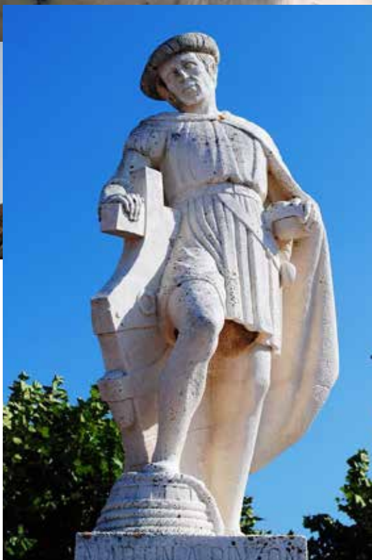
Statut du capitaine de la caravelle Pinta, Martín Alonso Pinzón.