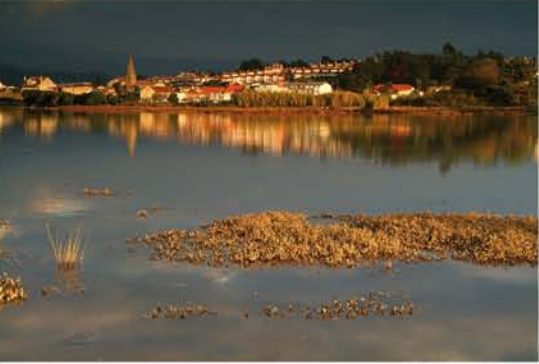
"A Foz do Miñor" marsh